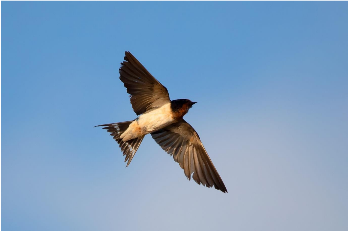
ภาพที่ 2: นกนางแอ่นบ้าน (Barn Swallow) เป็นนกที่สำรวจพบเป็นจำนวนมากที่สุด