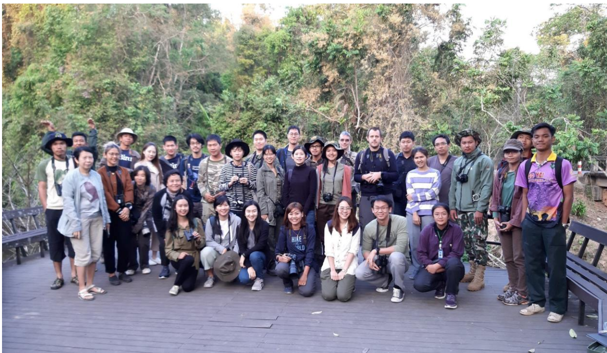
ภาพที่ 1: ผู้เข้าร่วมการสำรวจประชากรนกในอุทยานแห่งชาติเขาใหญ่ 2563

กำหนดวางแผนสำรวจ (trail site) จำนวน 11 เส้นทาง โดยจะเน้นไปยังพื้นที่ที่มีลักษณะเฉพาะ เช่น ป่าดิบเขา (Hill Evergreen forest) ทุ่งหญ้า (Grass land) ป่าดิบแล้ง (Dry Evergreen forest) และป่าเบญจพรรณ (Mixed deciduous forest) ความสูงของแนวสำรวจ (Altitude) ที่แตกต่างกันให้ครอบคลุมทุกระบบนิเวศ รวมถึงการกำหนดความยาวของเส้นสำรวจ (Transection) ซึ่งขึ้นอยู่กับสภาพของพื้นที่ที่เป็นตัวแทนของระบบนิเวศ จุดเริ่มต้น (start) และจุดสิ้นสุด (finish) ระยะความยาวของเส้นสำรวจ 3 กิโลเมตร