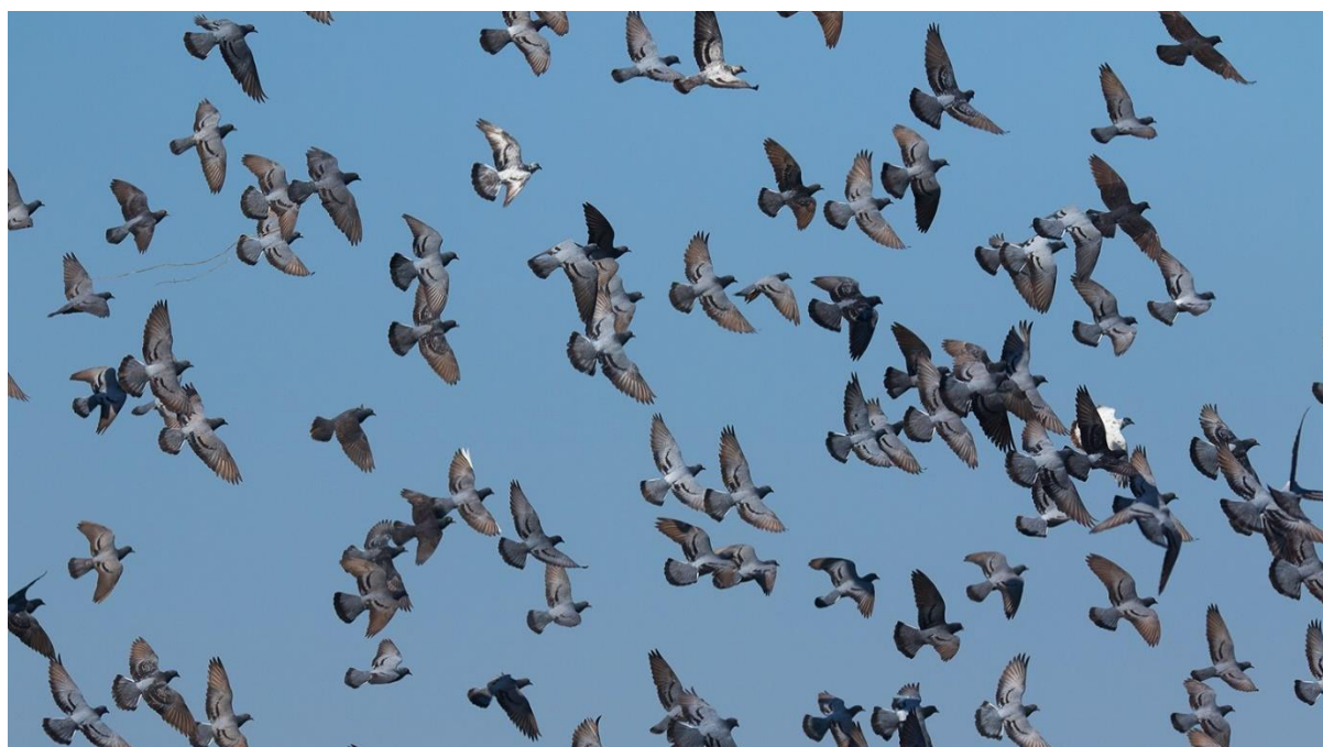
ภาพที่ 3 นกพิราบป่า ( Columba livia )

นกพิราบป่าเป็นนกที่จัดได้ว่าเป็นชนิดพันธุ์ต่างถิ่นที่รุกราน (Invasive alien species) ถูกนำเข้ามายังเมืองไทยโดยมนุษย์และสามารถปรับตัวให้อาศัยอยู่ในเขตชุมชนได้ดีเยี่ยม ส่งผลกระทบต่อสัตว์และระบบนิเวศดั้งเดิม รวมไปถึงสร้างความรำคาญและเป็นพาหะนำโรคที่สามารถติดต่อไปยังมนุษย์ได้อีกด้วย จึงควรมีการเฝ้าระวังและติดตามแนวโน้มประชากรของนกพิราบป่าในพื้นที่อุทยานอย่างต่อเนื่อง เพื่อกำหนดมาตรการป้องกันและควบคุมประชากรของนกพิราบป่าต่อไป