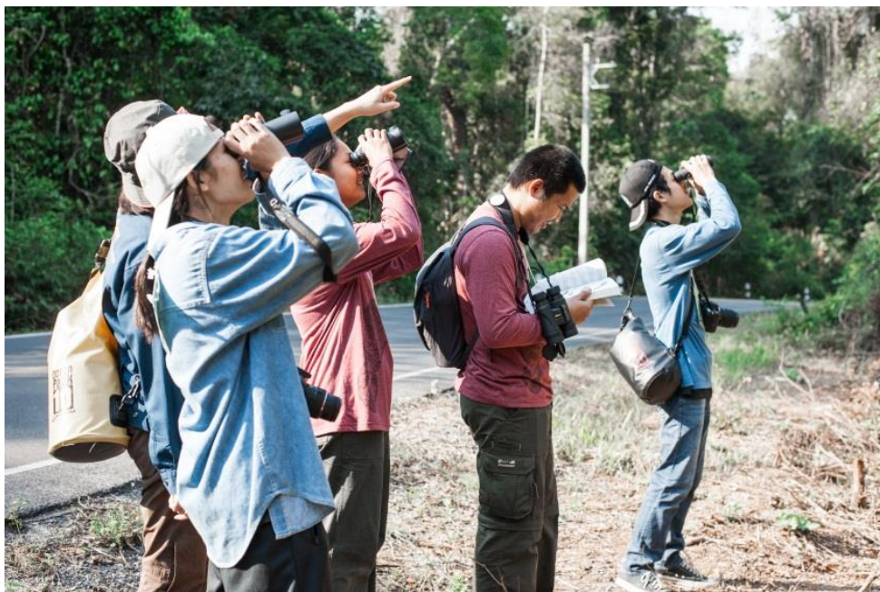
ภาพที่ 1 การสำรวจประชากรนกในอุทยานแห่งชาติเขาใหญ่

กำหนดวางแผนสำรวจ (trail site) จำนวน 11 เส้นทาง โดยจะเน้นไปยังพื้นที่ที่มีลักษณะเฉพาะ เช่น ป่าดิบเขา (Hill Evergreen forest) ทุ่งหญ้า (Grass land) ป่าดิบแล้ง (Dry Evergreen forest) และป่าเบญจพรรณ (Mixed deciduous forest) ความสูงของแนวสำรวจ (Altitude) ที่แตกต่างกันให้ครอบคลุมทุกระบบนิเวศ รวมถึงการกำหนดความยาวของเส้นสำรวจ (Transection) ซึ่งขึ้นอยู่กับสภาพของพื้นที่ที่เป็นตัวแทนของระบบนิเวศ จุดเริ่มต้น (start) และจุดสิ้นสุด (finish) ระยะความยาวของเส้นสำรวจ 3 กิโลเมตร